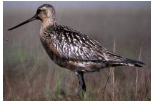
La barge rousse est capable de faire plus de 10 000 km en 8 jours sans toucher le sol.

Certains oiseaux sont capables de faire des milliers de kilomètres sans s'arrêter . Ils peuvent se nourrir en vol et même dormir en planant.